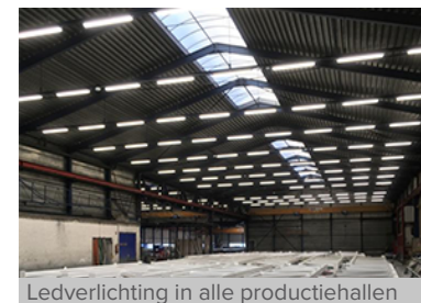
Ledverlichting in alle productiehallen