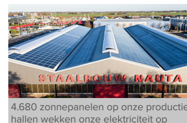
4.680 zonnepanelen op onze productiehallen wekken onze elektriciteit op

Disclaimer • uitgedrukt in ton • berekend volgens CO 2 -prestatieladder en de SKAO methodiek • 2015 is ijkpunt