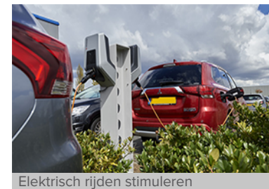
Elektrisch rijden stimuleren